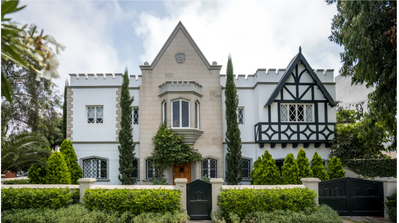
Hotel Atemporal.